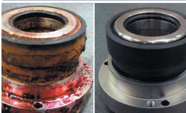
Garniture mécanique avant et après intervention