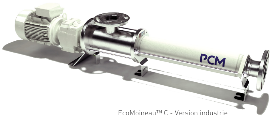
EcoMoineau™ C - Version industrie

La nouvelle pompe EcoMoineau™C est idéale pour le marché de l'agroalimentaire (viande et nutrition animale, sucre et amidons, plats préparés et boissons) et pour le marché de l'industrie (chimie, minéraux, papier, environnement).