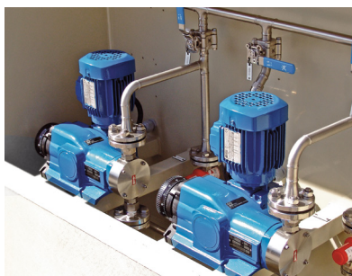
Dosage d'acide sulfurique en industrie minière