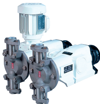
Lagoa LG2 Duplex