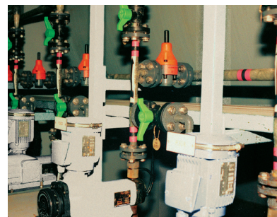
Pompage de chlorure ferrique en station d'épuration.