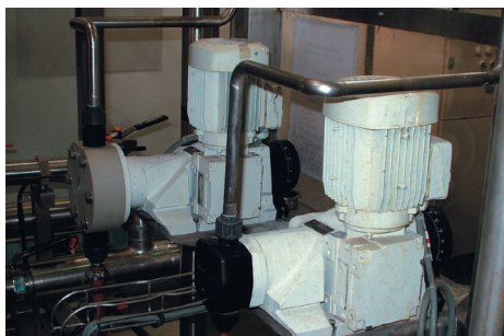
Dosage de soude et acide